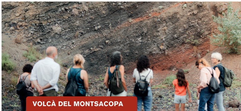
VOLCÀ DEL MONTSACOPA

Amb la col·laboració: Consorci d'Acció Social de la Garrotxa.