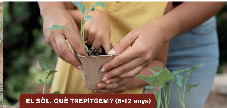
EL SÒL. QUÈ TREPITGEM? (6-12 anys)

Per què els volcans es vesteixen de verd? Què fa que les terres volcàniques siguin tan especials? En aquest taller investigarem les propietats de les terres volcàniques a partir de diferents experiments i anàlisis, i descobrirem per què són tan bones per a les plantes. A continuació, crearem la composició de terra perfecta, per sembrar les plantes que ens endurem a casa!