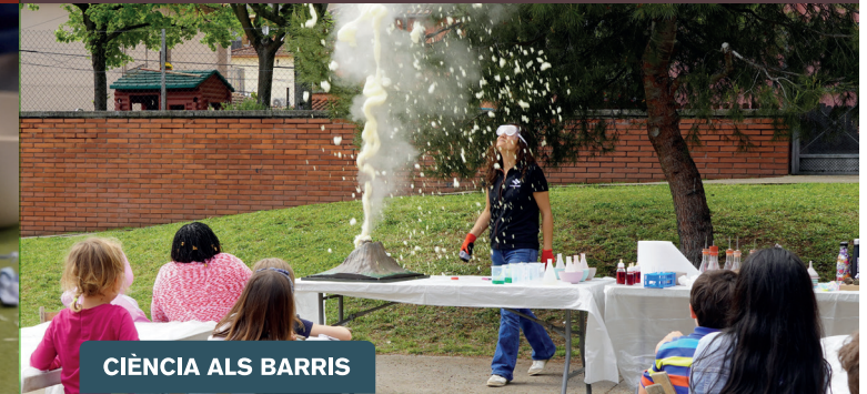
CIÈNCIA ALS BARRIS

Tornem a sortir al carrer per fer ciència! A través d'experiments, reptes i jocs entendrem com s'han format i com es vigilen el nostres volcans. Finalment, tots junts farem una gran erupció!