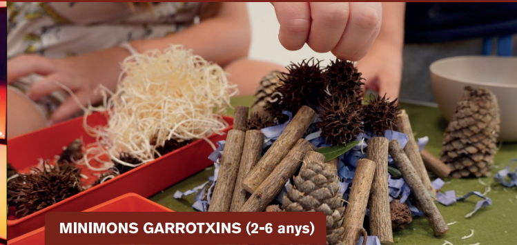
MINIMONS GARROTXINS (2-6 anys)

Quins paisatges trobem a la Garrotxa? La nostra comarca és terra de boscos, rius, zones humides, poblets, ciutats i també de paisatges... volcànics! En aquesta activitat descobrirem els paisatges que ens envolten mentre juguem a crear els nostres minimons garrotxins!