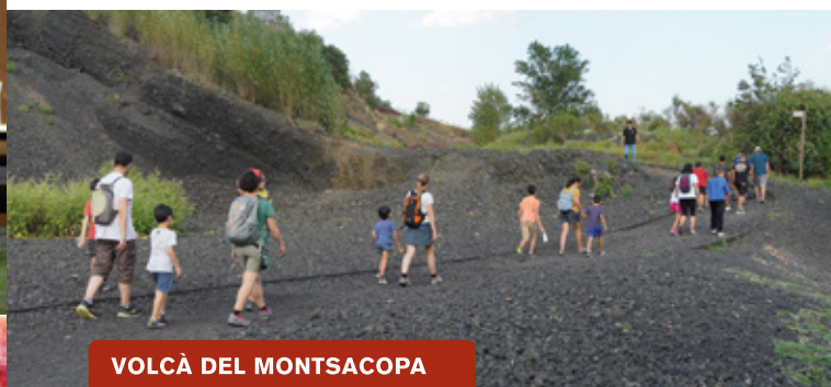
VOLCÀ DEL MONTSACOPA

El volcà del Montsacopa com mai no l'has vist! Quina ha estat la seva activitat volcànica? Quins són els seus materials i característiques? Visita el cràter i les grederes amb els comentaris dels nostres guies especialitzats.