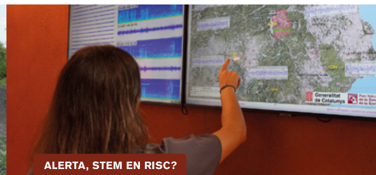
ALERTA, STEM EN RISC?

Edat recomanada: Famílies amb infants d'entre 2 i 6 anys.